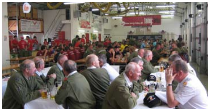
Verpflegung beim Abschnittsbewerb im Feuerwehrhaus Walding.

le Walding und der Familie Bumberger für die großartige Hilfe und Unterstützung bei der Durchführung des Bewerbes.