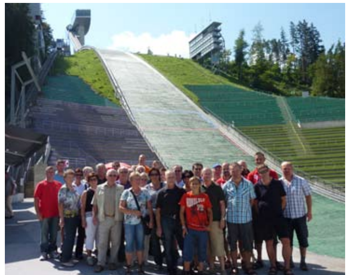
Beeindruckend war die Besichtigung der Bergisel-Schanze in Innsbruck.

1800m Seehöhe. Die Alpenstraße ist sehr eng und geht teilweise durch einspurige, rohgehauene Tunnel mit Ampelregelung. Nach einer Staumauerführung in der Schlegeissperre konnten wir beim Mittagessen