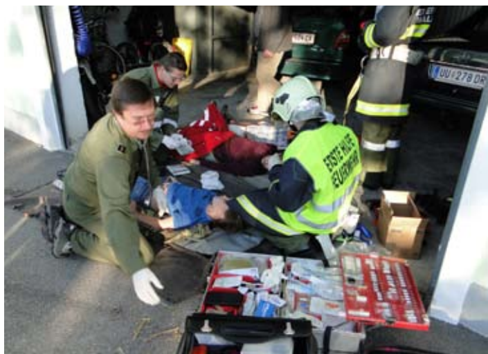
Feuerwehrarzt und Feuerwehr-Ersthelfer bei der Herbstübung 2011.

Zu finden unter http://www.rotekreuz.at/nocache/site/mobile-phone-app-vom-roten-kreuz-und-kfv/ oder von der Startseite www.rotekreuz.at . Viel Spaß beim Ausprobieren!