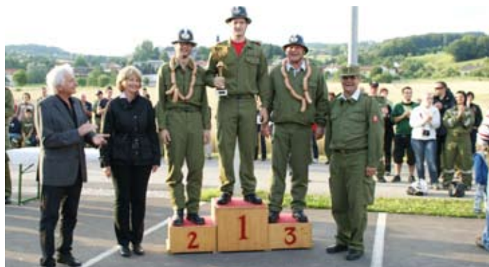
Die Sieger der Gemeindewertung Walding