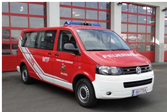
Neues Mannschaftstransportfahrzeug (MTF) der FF Walding.

Das Kommandofahrzeug der Feuerwehr Walding ist Baujahr 1979 und wurde 32 Jahre alt. Das Fahrzeug ist für längere Fahrten nicht mehr geeignet. Für Fahrten unserer Jugendgruppe, der Zil-