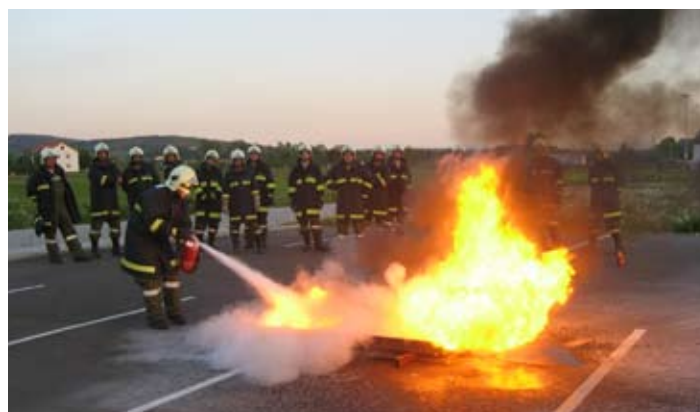
Feuerlöscherübung im April 2011.

wir ins ASZ Walding aus. Brandbekämpfung mit Feuerlöscher stand im April am Programm. Eine Ölwanne wurde immer wieder angeheizt, das ermöglichte jedem