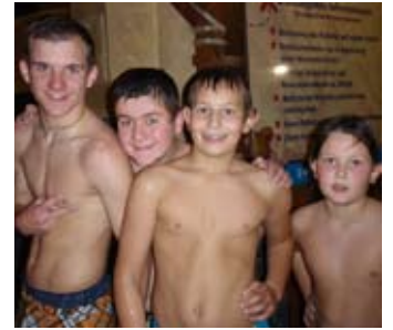
„Pirates of Schallerbach“

Gerne können sich auch im Jahr 2012 Jugendliche im Alter von 10-16 Jahren unserer Jugendgruppe an-