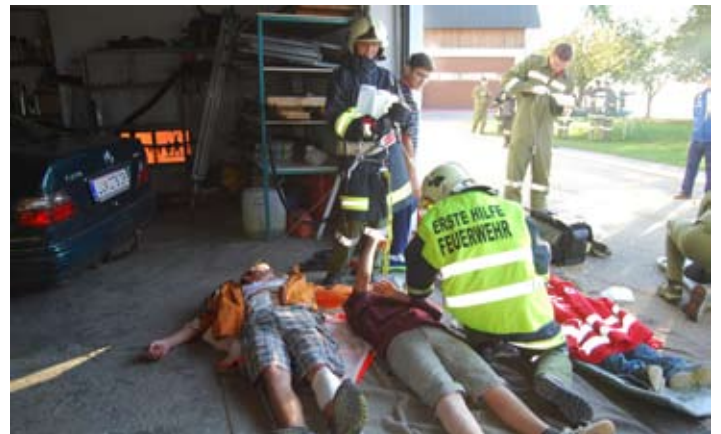
Erstversorgung der Verletzten durch Feuerwehrarzt und FW-Ersthelfer.

Autohaus Ihr kompetenter Partner für Wögerbauer