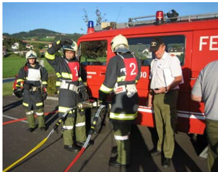
Der Rettungstrupp bei der Vornahme von Spreizer und Schere.