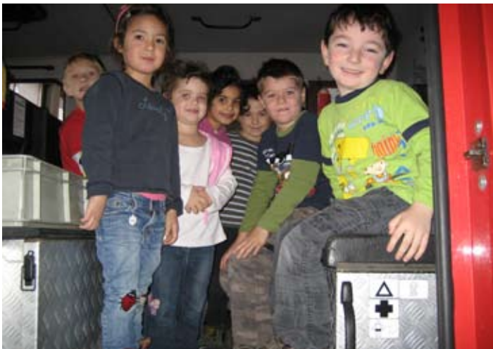
Einen Riesenspaß machte auch das Probesitzen im Einsatzfahrzeug.

Vom 14. - 17. November bekam die Feuerwehr Walding Besuch von mehreren Kindergartengruppen. Die