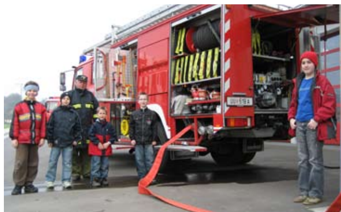
Mitgliederwerbung beim Jugendinfotag Mitte März 2011.