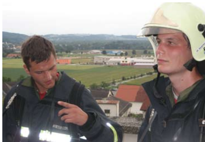
Schweißtreibende Atemschutzübung im Sommer.

nahme an Lehrgängen wird unsere Gruppe weiters sehr gut ausgebildet und stärkt das allgemeine Feuerwehrwissen ganz besonders. An dieser Stelle bedanke ich mich außerdem für die engagierte Arbeit meiner Kameraden. Zum Abschluss danke ich