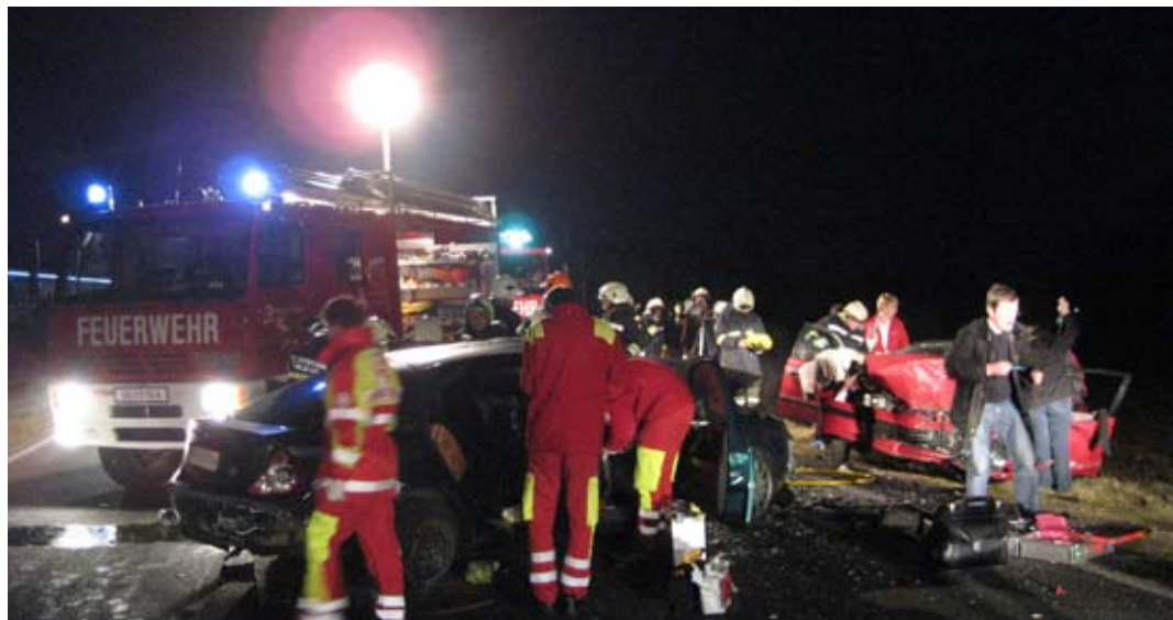
Notarzt, Feuerwehr-Ersthelfer und Rettungssanitäter beim Verkehrsunfall B127 auf Höhe Werkstatt Punzenberger.

Am 28.11. war auf der B127 in Höhe der Werkstatt Punzenberger ein schwerer Verkehrsunfall. Bei dem Frontalzusammenstoß zweier PKWs wurden vier Personen in ihren Autos eingeklemmt. Plötzlich musste in diesem Ernstfall Gelerntes und oft Geübtes so rasch wie möglich angewendet werden. In solch einer Situation muss schnell gehandelt werden und alles soll, so wie bei einer Übung, am Schnürriechen ablaufen. Bei diesem Verkehrsunfall haben die Feuerwehren gezeigt, wie