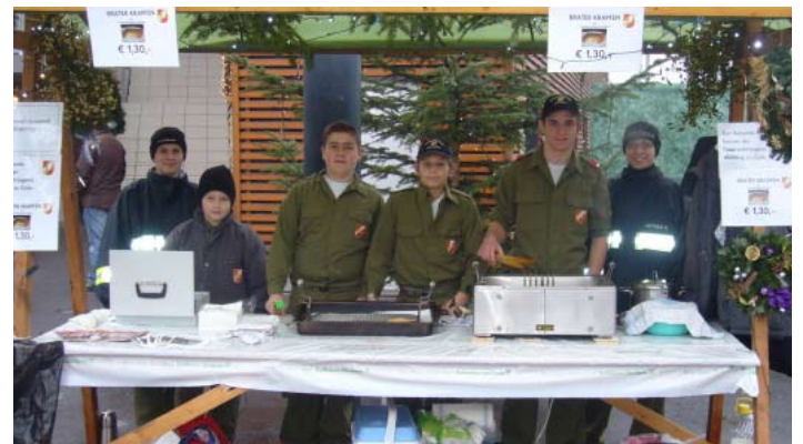
Lustiger Verkaufstag am Adventmarkt

An dem toll dekorierten Stand, verkauften wir viele mit Kartoffeln und Käse gefüllte Krapfen.