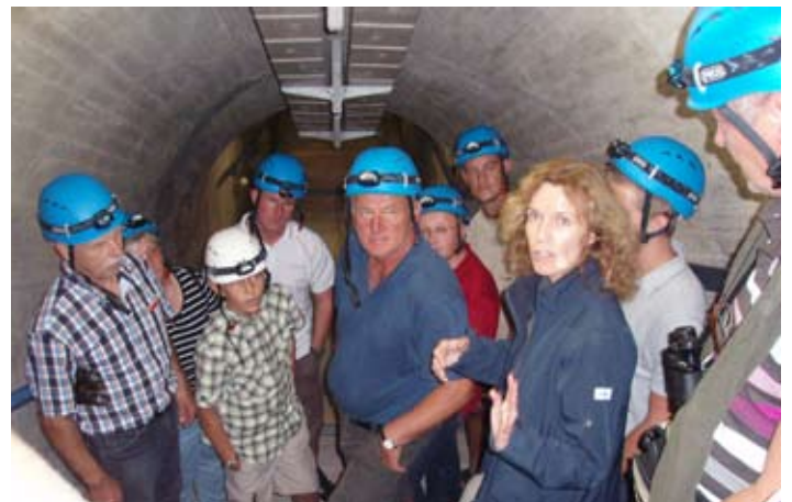
Staumauerführung in der Schlegeissperre.

Gerlospaß vorbei an den Grimmler Wasserfällen. Nach einer Rast in der Nähe von Salzburg trafen wir am Abend wieder wohlbehalten in Walding ein.