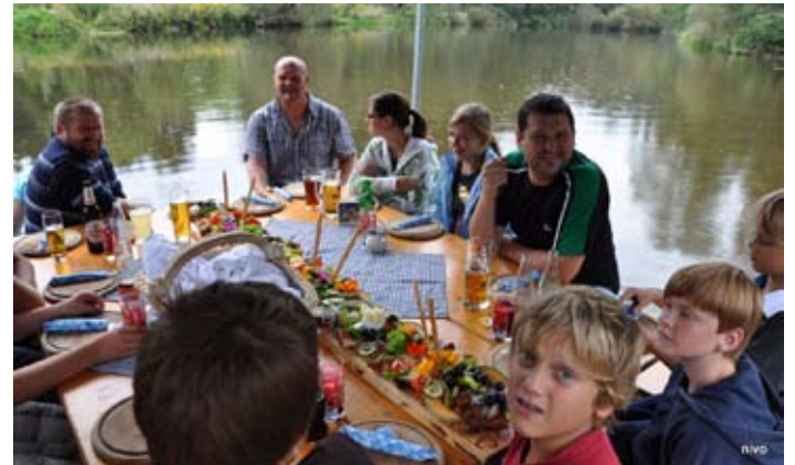
Gemütlicher Saisonabschluss bei einer Floßfahrt in der Teufelmühle.

schließen. Infos auf unserer Homepage www.feuerwehr-walding.at