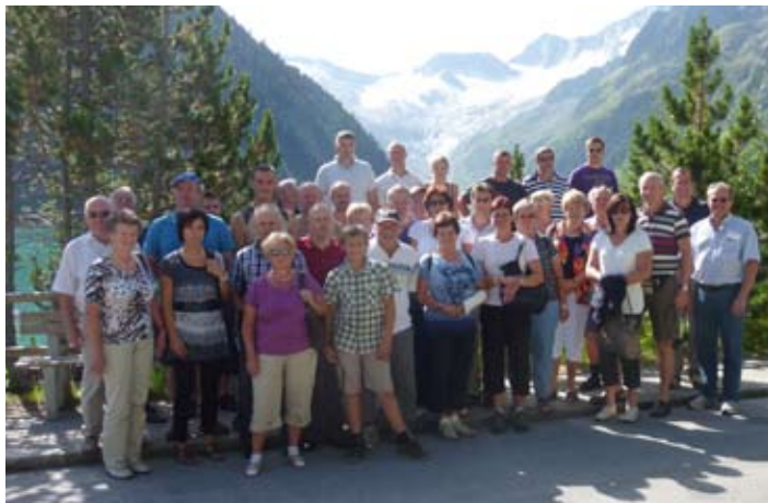
Vor dem Schlegeisstausee mit den Zillertaler Alpen im Hintergrund.

Programme. Danach ging es mit dem Reisebus weiter in Richtung Zillertal zu unserem Quartier im Gasthof Untermetzger in Zell am Ziller. Am zweiten Tag ging die Fahrt durch das Zillertal nach Mayrhofen und entlang der Schlegeis-Alpenstraße über Ginzling zum Schlegeis-Stausee auf