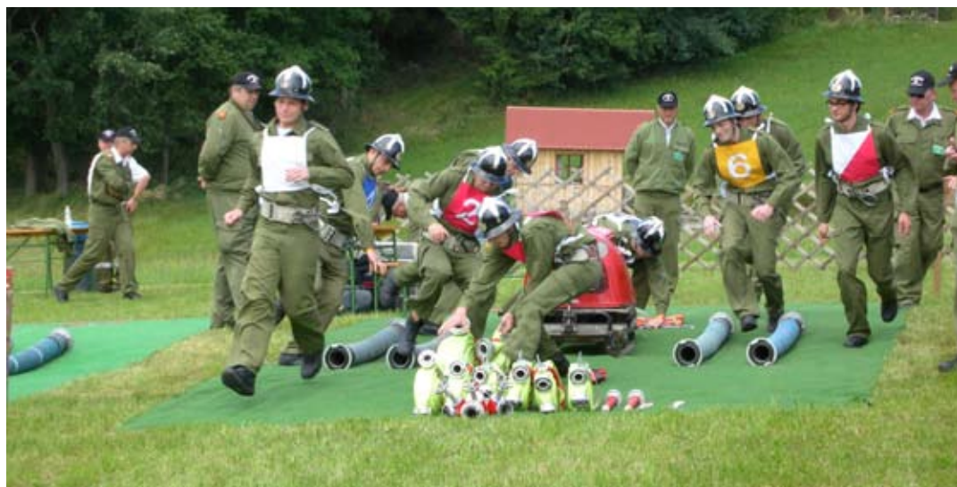
Bewerbsgruppe 1 beim Abschnittsbewerb in Pröselsdorf.

dorf errangen 9 Kameraden das Leistungsabzeichen in Bronze und 6 Kameraden das Abzeichen in Silber. Leistungsabzeichen in Bron-