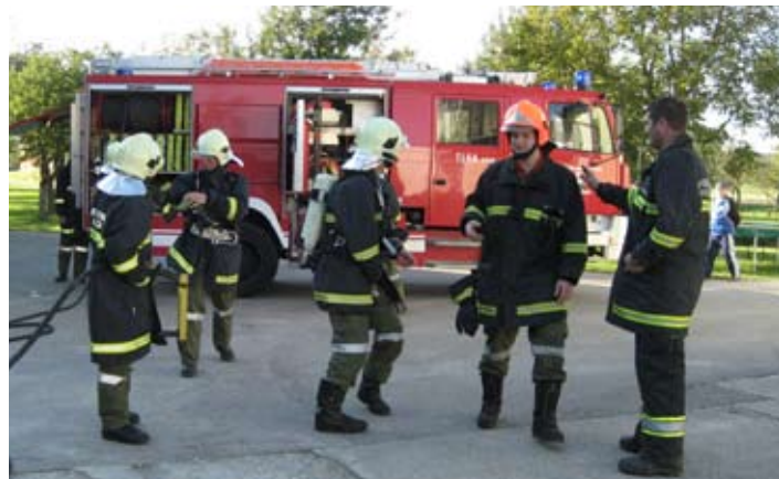
Erster Atemschutztrupp bei der Vorbereitung zum Innenangriff.