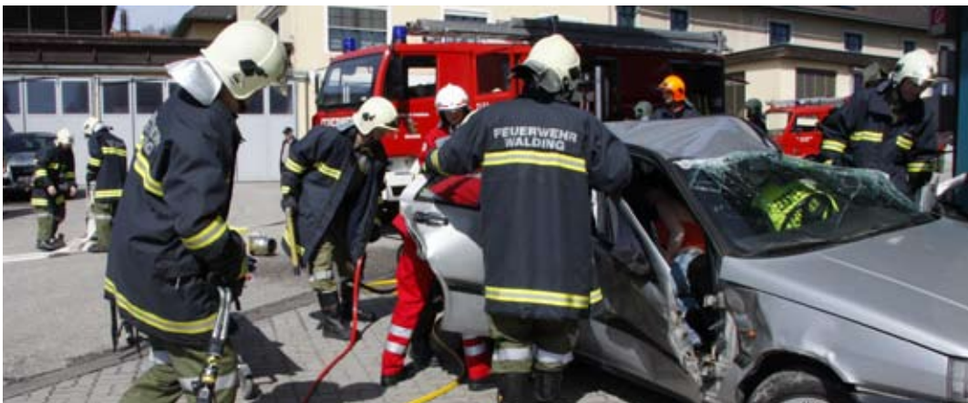
Technische Hilfeleistung mit dem Hydraulischen Rettungsgerät zur Personenrettung aus dem Unfallauto.