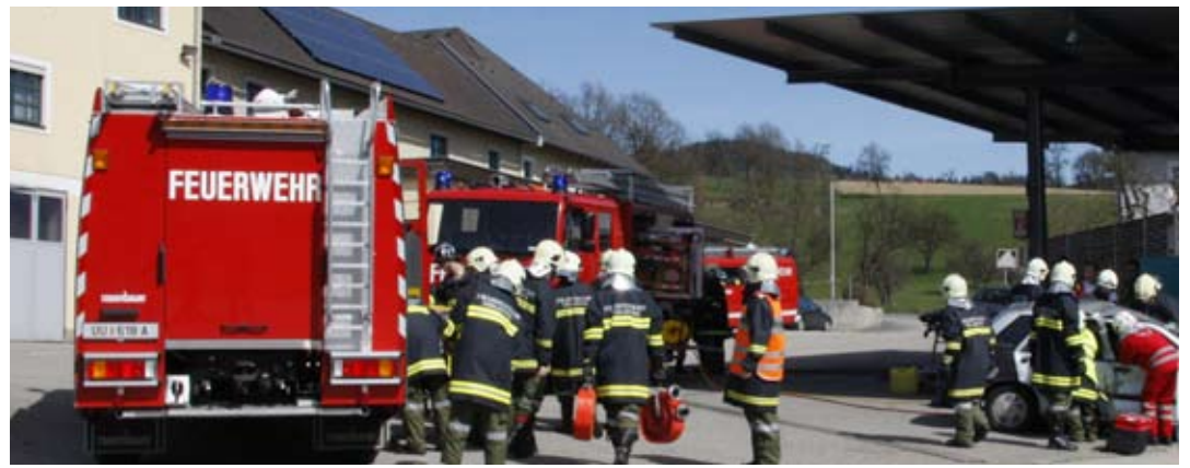
Frühjahrsübung 2011 am Firmengelände der Firma Zellinger mit Verkehrsunfall mit eingeklemmten Personen.

Die Frühjahrsübung wurde am 2. April 2011 als technische Einsatzübung für alle Löschgruppen durchgeführt. Übungsannahme war ein Zusammenstoß zwischen einem PKW und einem Kleinbus am Zellinger Firmengelände. Sechs Verletzte waren zum Teil im Fahrzeug eingeklemmt. Sofort nach Eintreffen der Einsatzfahrzeuge wurde die Einsatzstelle abgesichert. Gleichzeitig wurde der Brandschutz aufgebaut und