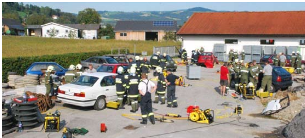
Sonderübung mit den Hydraulischen Rettungsgeräten im Altstoffsammelzentrum Walding.

wurden die Geräte im Feuerwehrhaus Walding einer technischen Überprüfung durch OAW Rudolf Poxru-