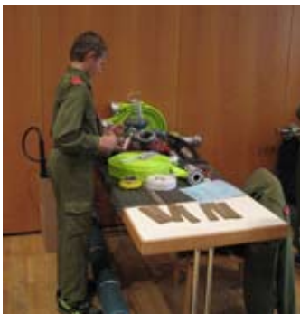
hren, das verbindet die Feuerwehrjugend jedes Jahr mit