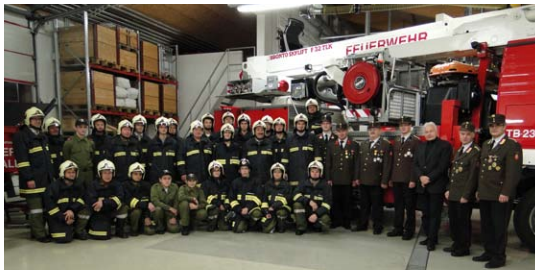
Übergabe der Fahrzeugschlüssel an die FF Walding im Feuerwehrhaus Walding.

Anschließend wird die neue TMB offiziell in den Dienst gestellt.