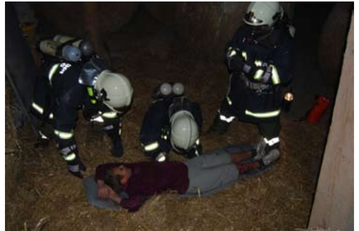
Atemschutztrupp bei der Rettung eines Verletzten.