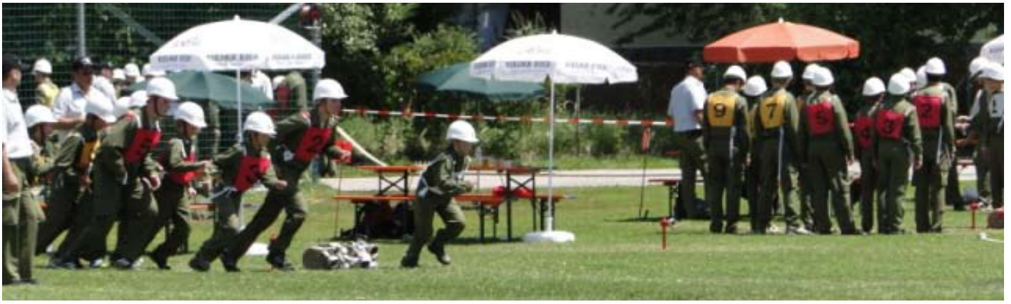
Die gemischte Jugendgruppe der Feuerwehren Walding und Rottenegg beim Landesbewerb in Andorf.